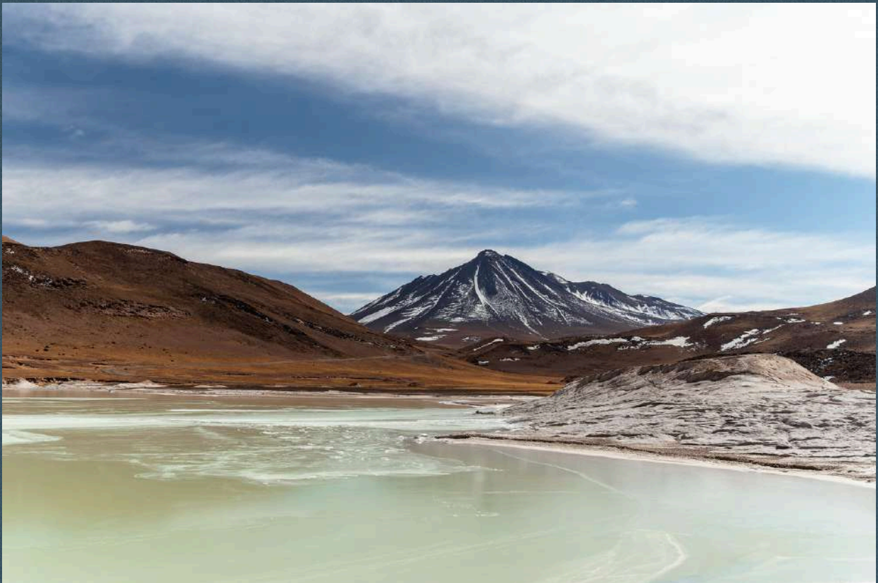
Obra: Piedras Rojas

É nas lagoas e oceanos que reside a origem da vida!