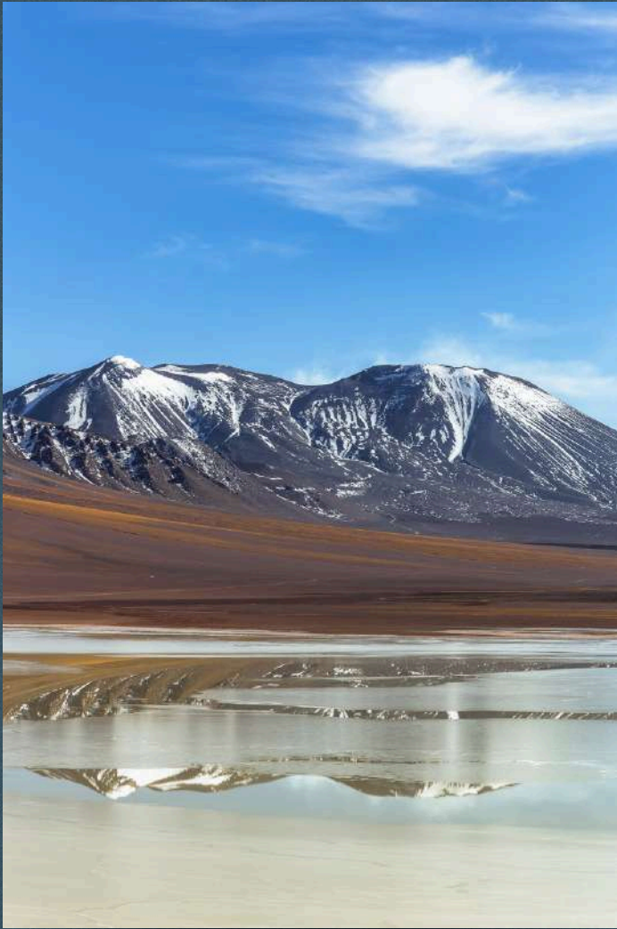
Obra: Lejía II