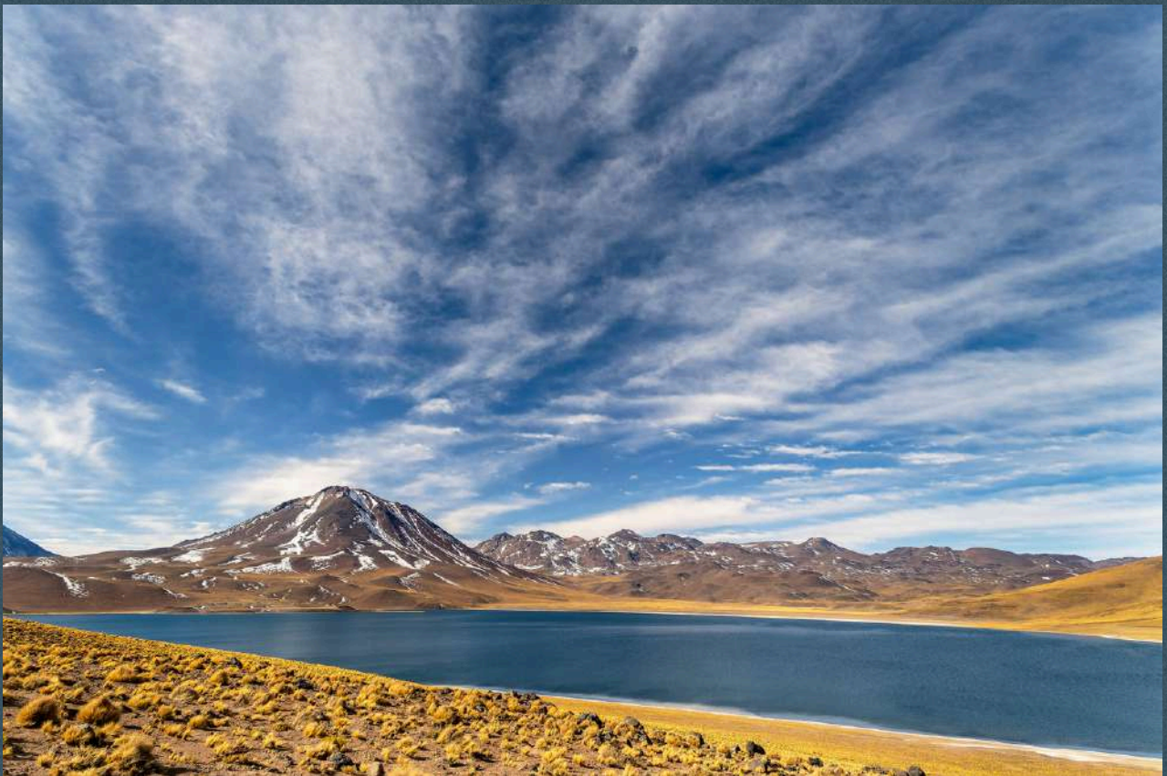
Obra: Miscanti II